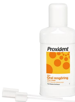
Proxident Oral rengöring