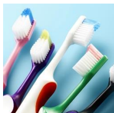
TePe Nova Extra mjuk