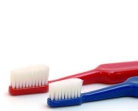
TePe Special Care