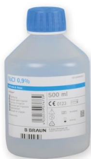
NaCl 0,9% (Koksalt-lösning)

Eller skölj med Proxident pH Balans som balanserar pH-värdet, ger en svalkande känsla vilket lindrar besvär vid torr och känslig mun, t.ex. vid inflammation i munslemhinnan. Har slemlösande effekt. Innehåller salter (bikarbonat) som finns naturligt i saliven.